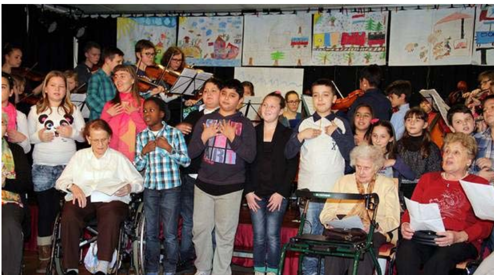
Ein neu getexteter "Neubau"-Walzer