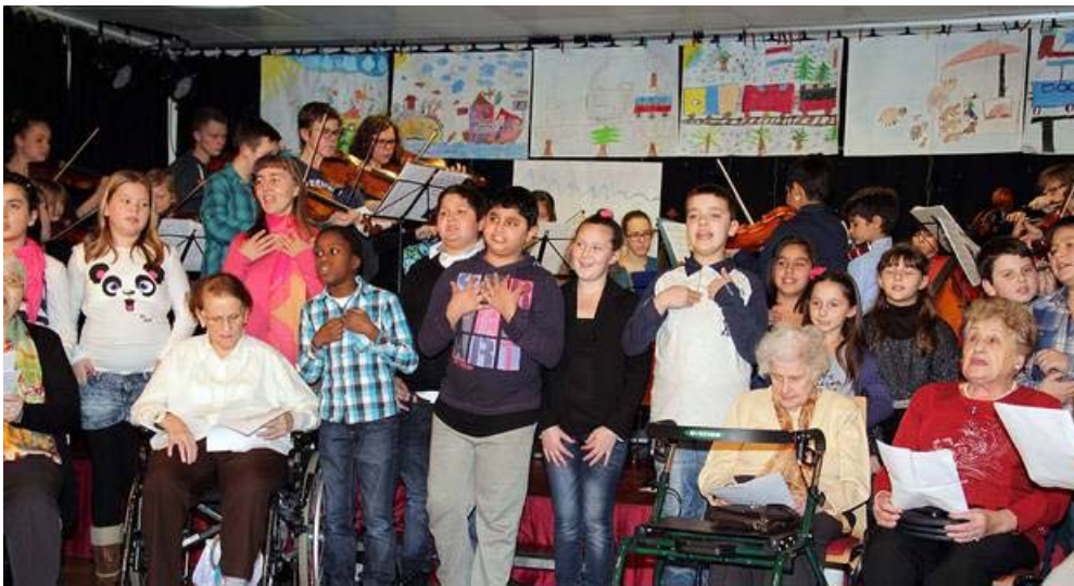
Ein neu getexteter "Neubau"-Walzer