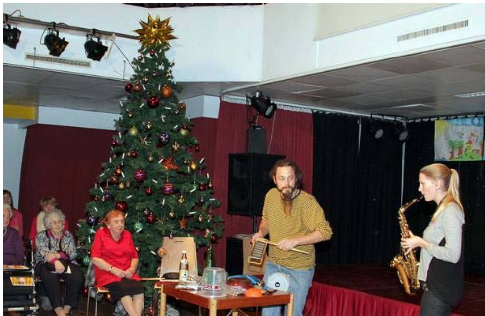
Studierende der Musikuni mit: Espresso Groove für Saxophon, Gitarre und Allerlei