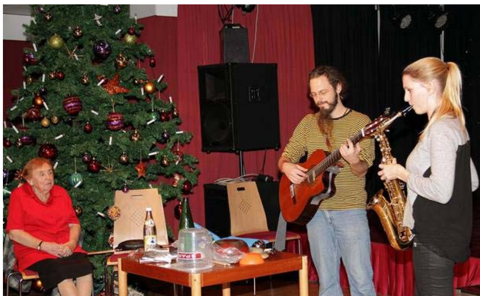
Studierende der Musikuni mit: Espresso Groove für Saxophon, Gitarre und Allerlei