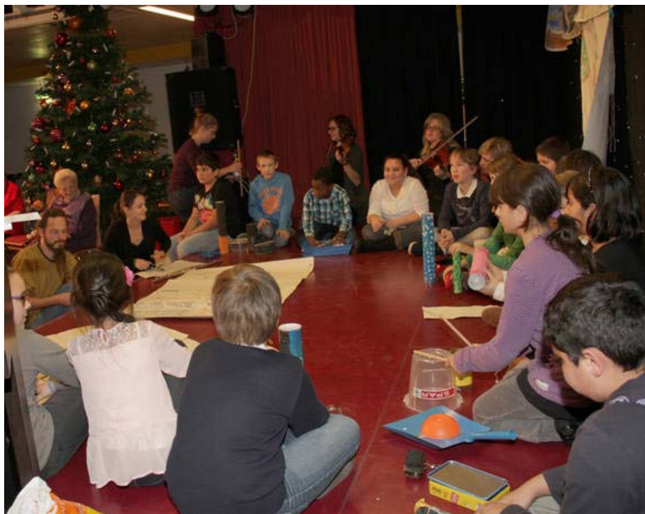
Komposition der 4A der VS Neustiftgasse