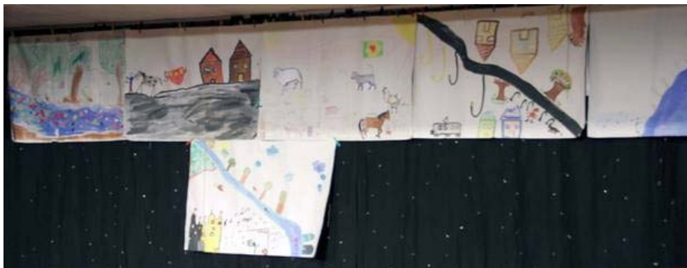
Die Bildergalerien aufbauend auf den Erzählungen der Älteren als Grundlage für die Kompositionen