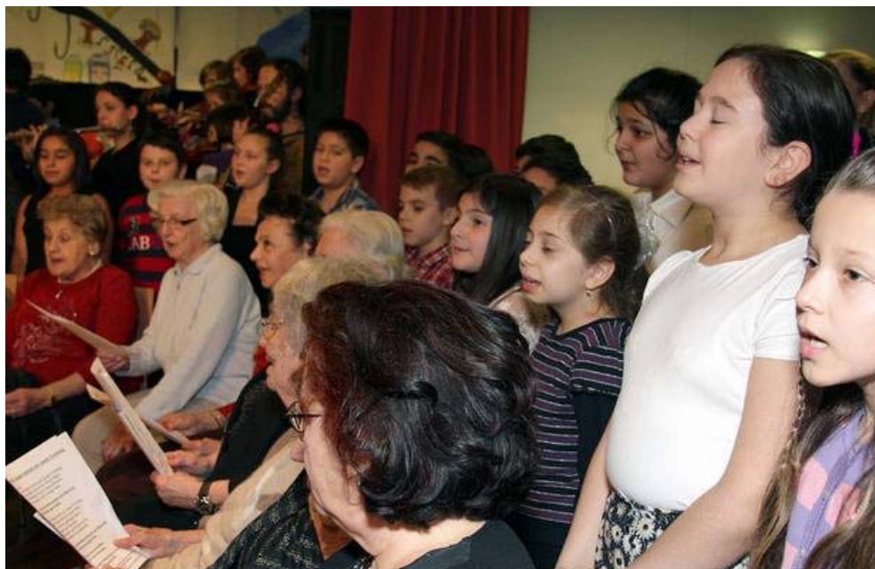
Gemeinsames Singen, unter anderem von "immer wieder kommt ein neuer Frühling" von Rolf Zuckowski