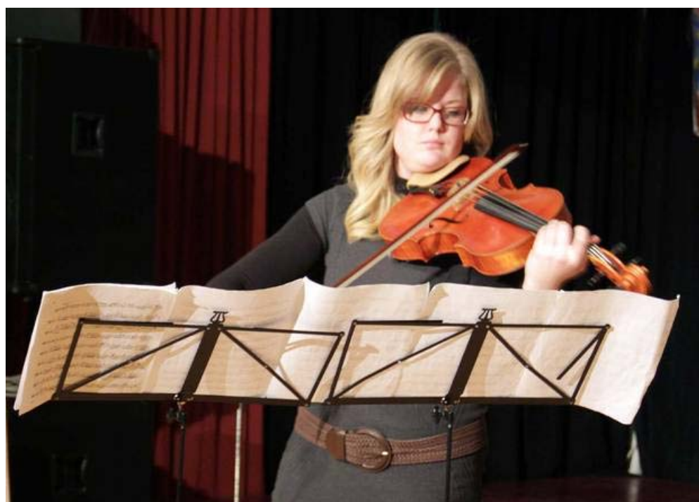
Studierende der Musikuni mit: Präludium aus Suite Nur. 5 von Johann Sebastian Bach