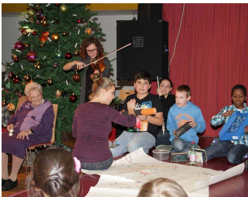
Komposition der 4A der VS Neustiftgasse