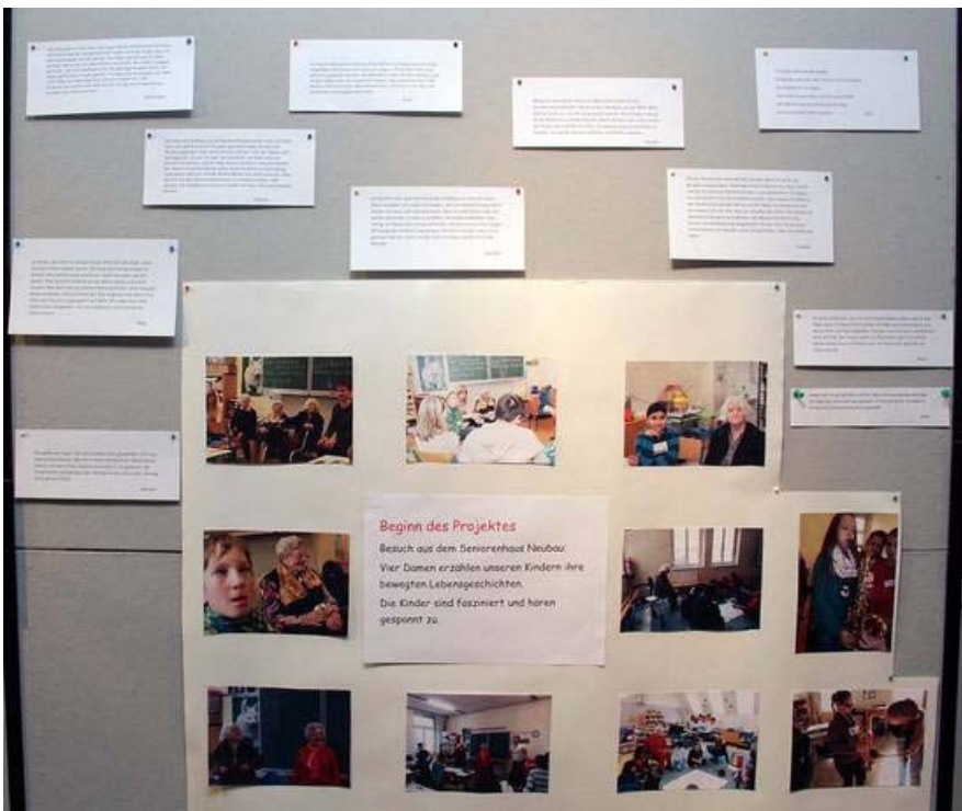
Ausstellungstafeln mit Erfahrungsberichten der Schüler_innen