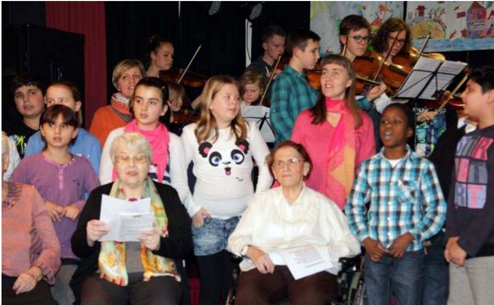
Ein neu getexteter "Neubau"-Walzer