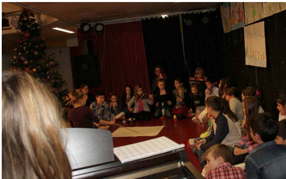
Kompisation der 4B derVS Neustiftgasse