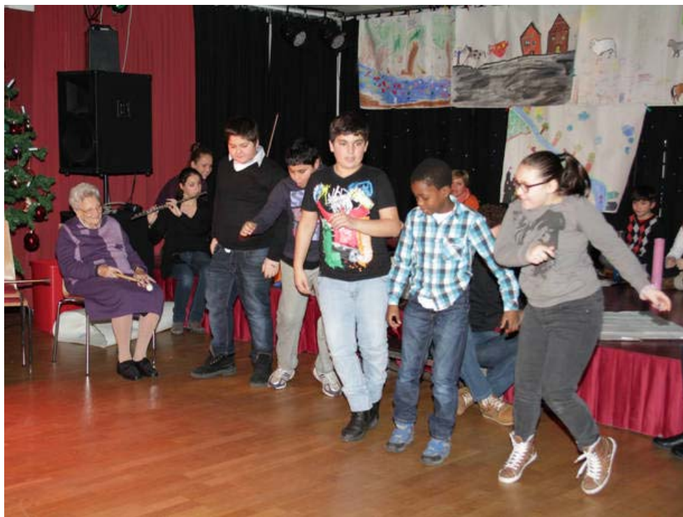
Komposition der 4A der VS Neustiftgasse