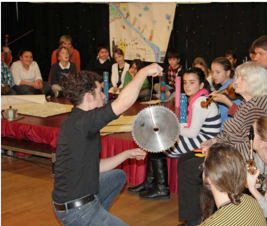
Komposition der 4A der VS Neustiftgasse