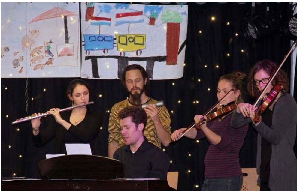
Studierende der Musikuni mit: All of Mee (Gerald Marks/Seymour Simons)