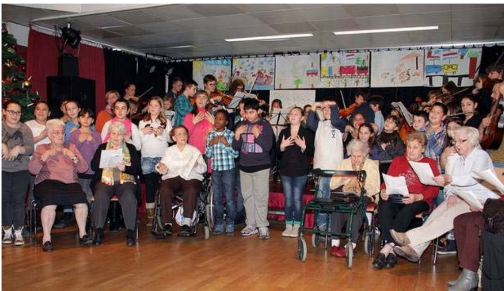
Ein neu getexteter "Neubau"-Walzer