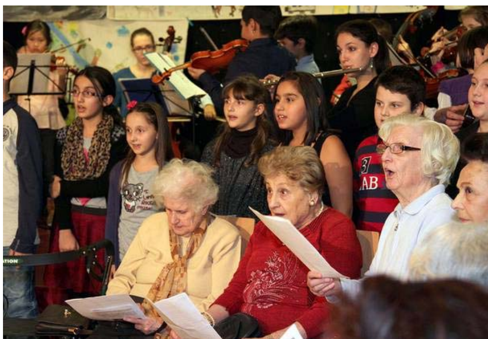
Gemeinsames Singen, unter anderem von "immer wieder kommt ein neuer Frühling" von Rolf Zuckowski