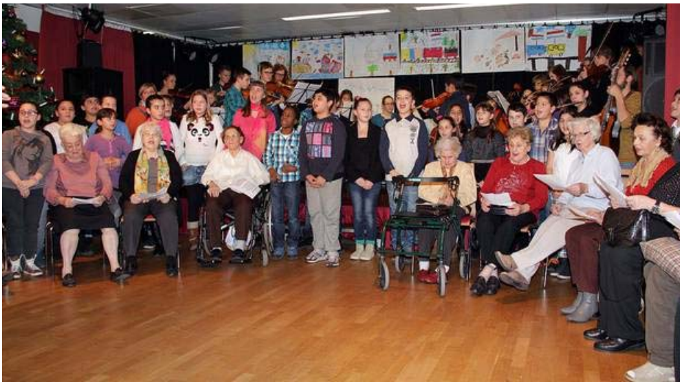
Ein neu getexteter "Neubau"-Walzer