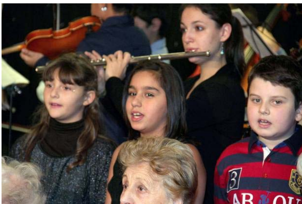
Gemeinsames Singen, unter anderem von "immer wieder kommt ein neuer Frühling" von Rolf Zuckowski