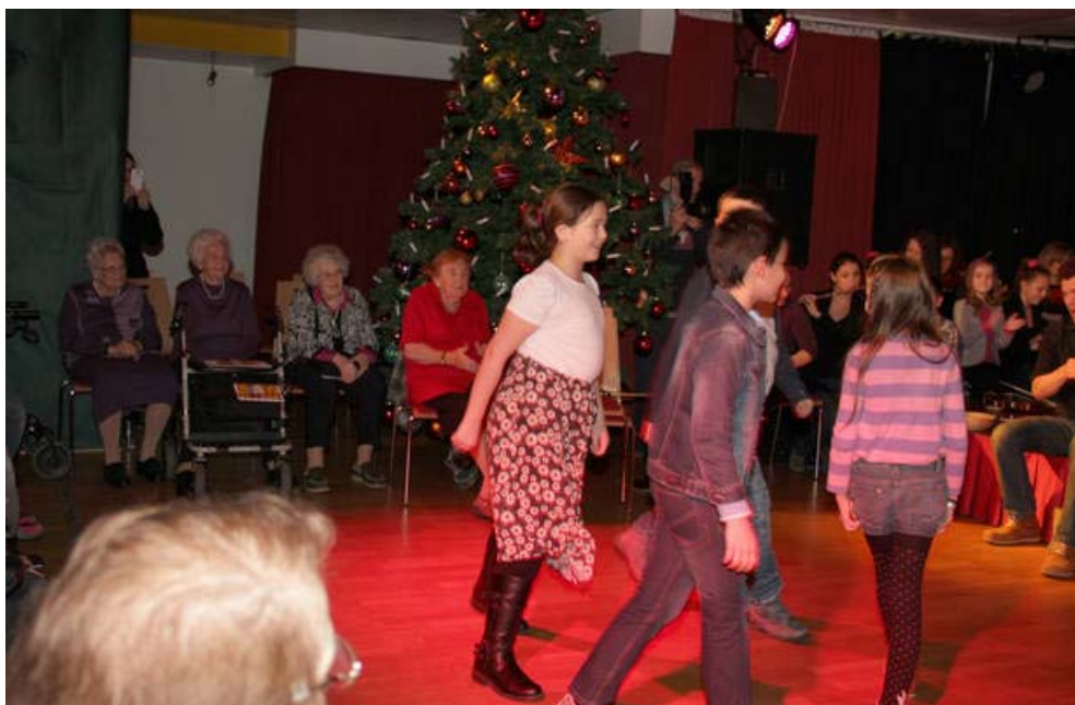
Kompisation der 4B derVS Neustiftgasse