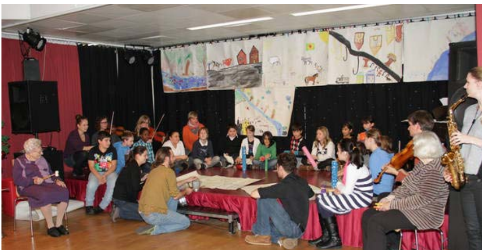
Komposition der 4A der VS Neustiftgasse