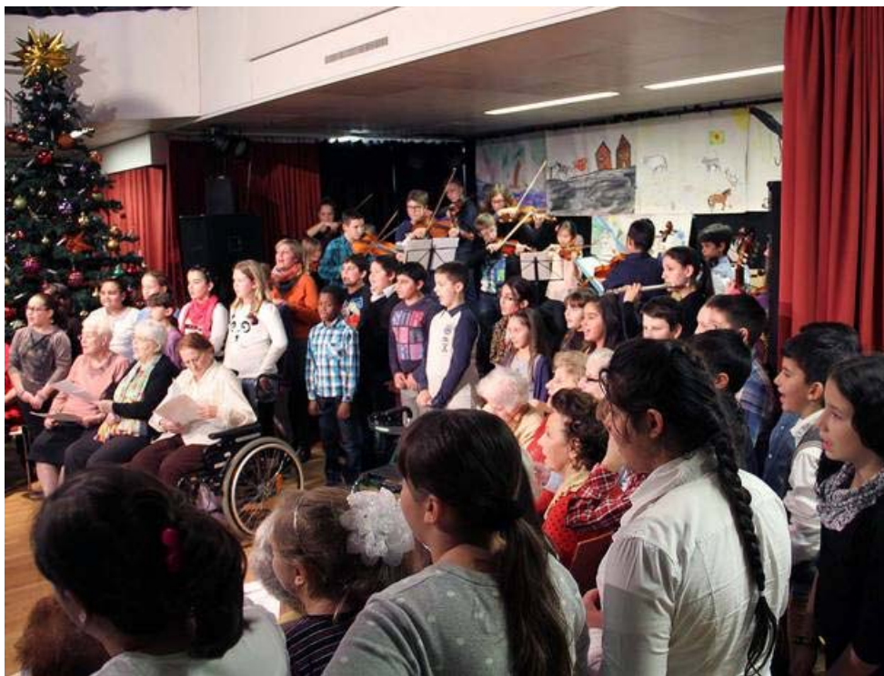
Gemeinsames Singen, unter anderem von "immer wieder kommt ein neuer Frühling" von Rolf Zuckowski