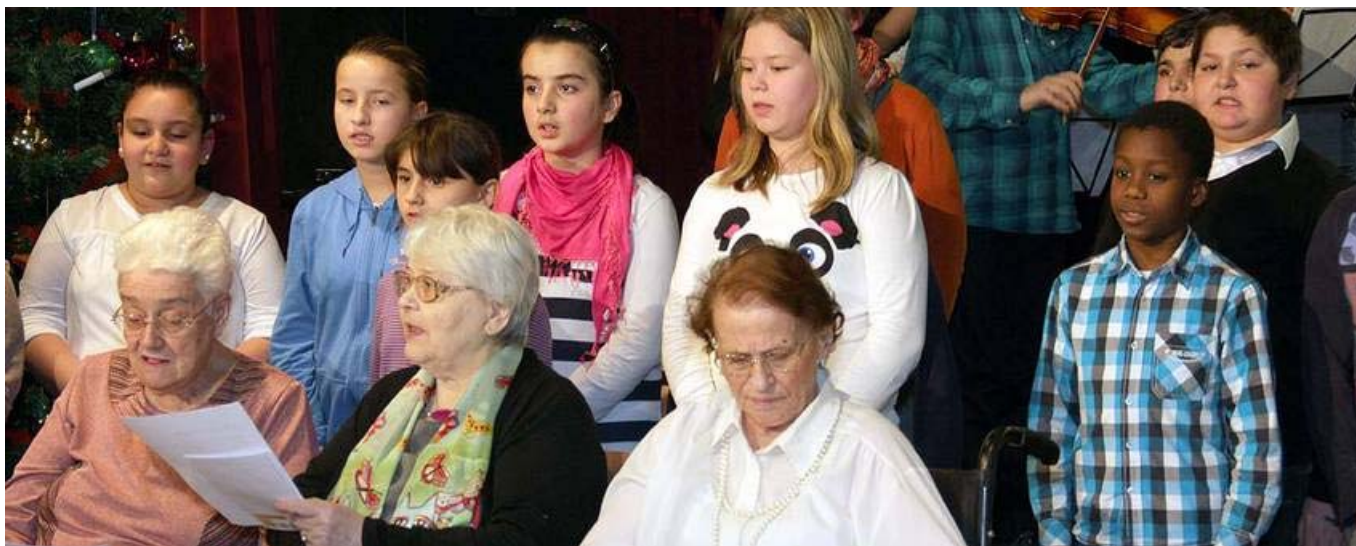
Gemeinsames Singen, unter anderem von "immer wieder kommt ein neuer Frühling" von Rolf Zuckowski

Genau so fröhlich wie die meisten Kinder lauthals sangen, nachdem sie die erste Angst vor dem Auftritt im vollbesetzten Saal im „Skydome“ des Nachbarschaftszentrums im der Wiener Schottenfeldgasse, blies die 85-jährige Frau in die große Pfeife. „Klingende Lebensgeschichten“ nennt sich das Projekt im Rahmen von „Musik zum Anfassen“. Schulkinder, Studierende der Wiener Musikuni, Kinder der städtischen Musikschule sowie ältere Menschen aus dem Pensionisten-Wohnhaus Neubau sangen, musizierten und tanzten (teilweise) beim Abschlusskonzert. Neben Klassikern (Bach, Bartók, Schubert...) standen jedoch im Zentrum zwei Klassenkompositionen – der 4a sowie der 4b der Volksschule Neustiftgasse.