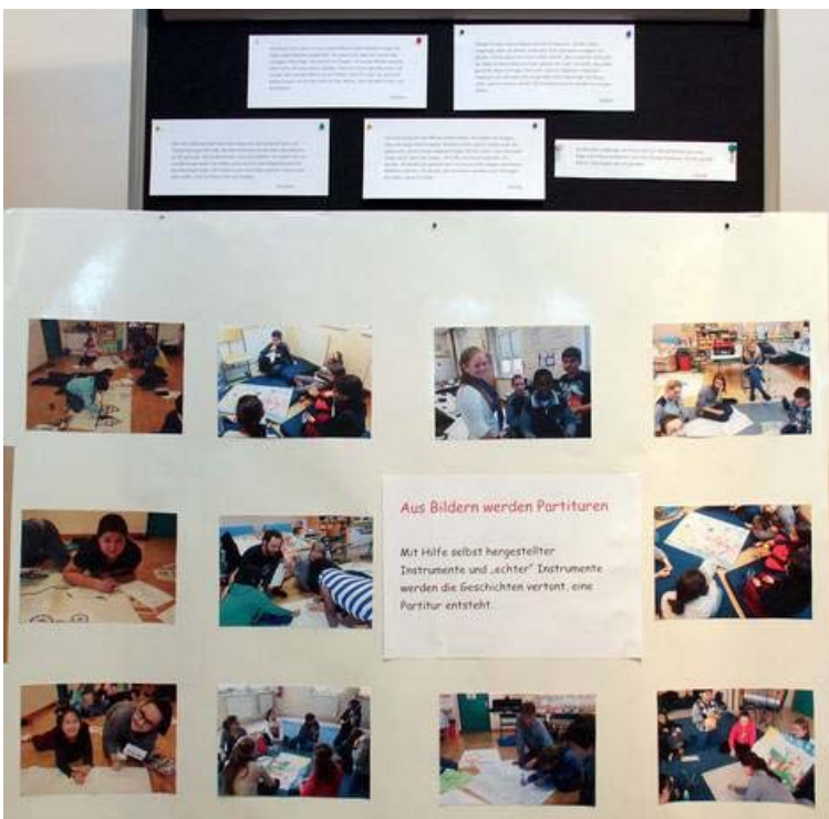
Ausstellungstafeln mit Erfahrungsberichten der Schüler_innen