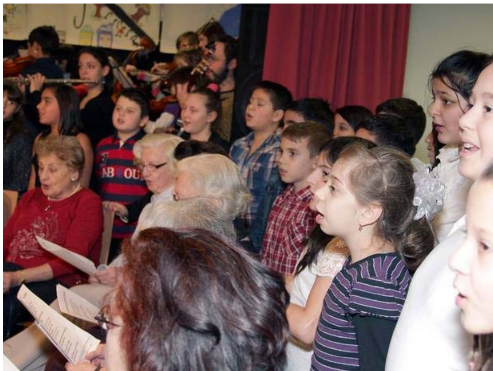
Gemeinsames Singen, unter anderem von "immer wieder kommt ein neuer Frühling" von Rolf Zuckowski