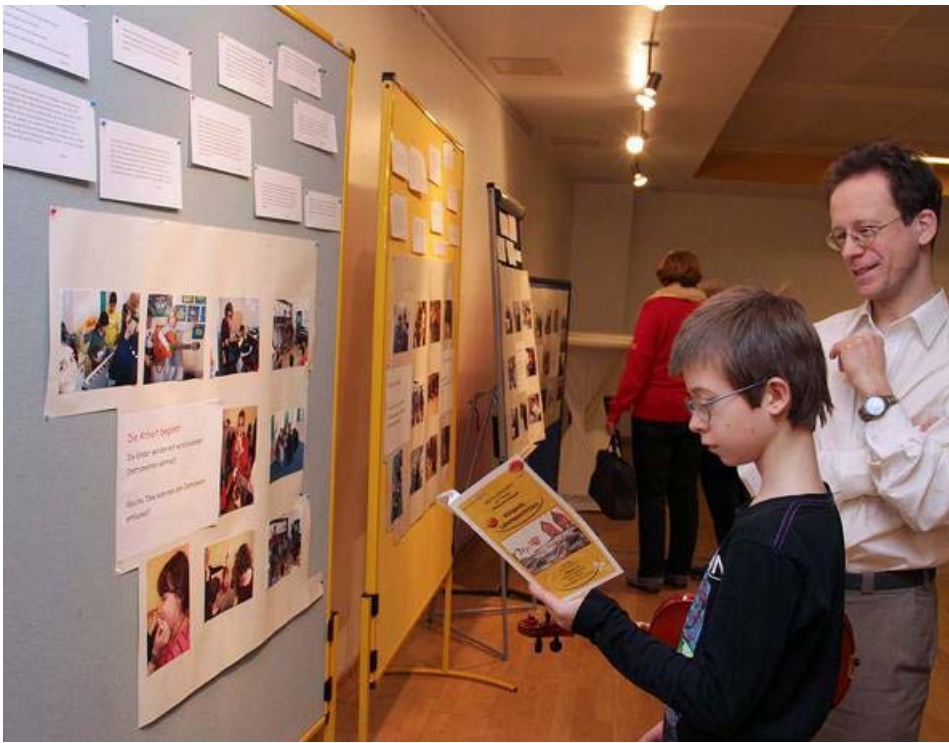
Ausstellungstafeln mit Erfahrungsberichten der Schüler_innen