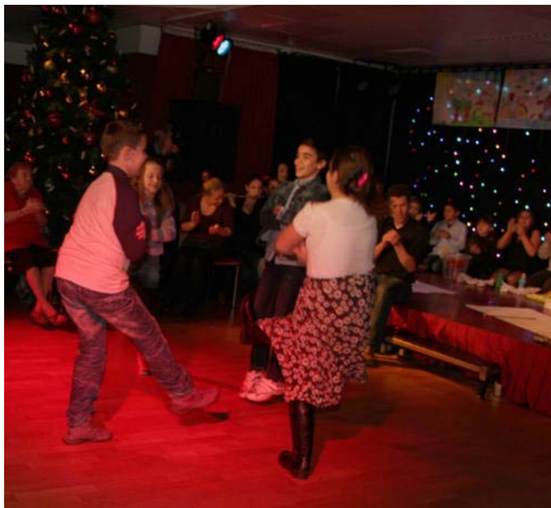
Kompisation der 4B derVS Neustiftgasse