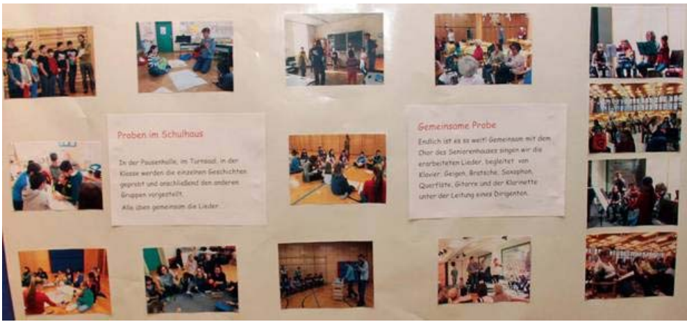
Ausstellungstafeln mit Erfahrungsberichten der Schüler_innen