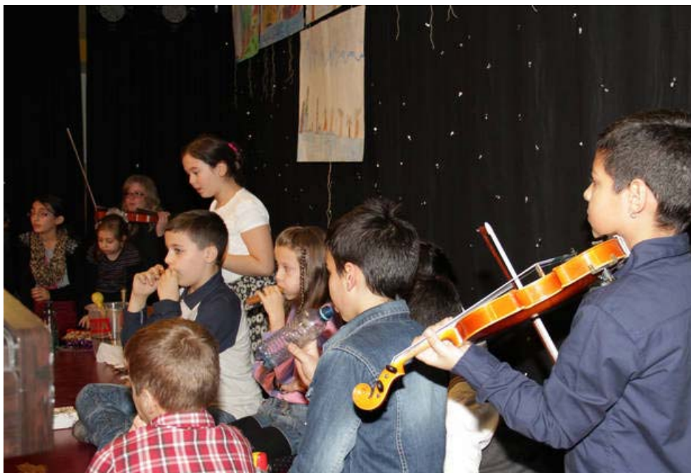
Kompisation der 4B derVS Neustiftgasse