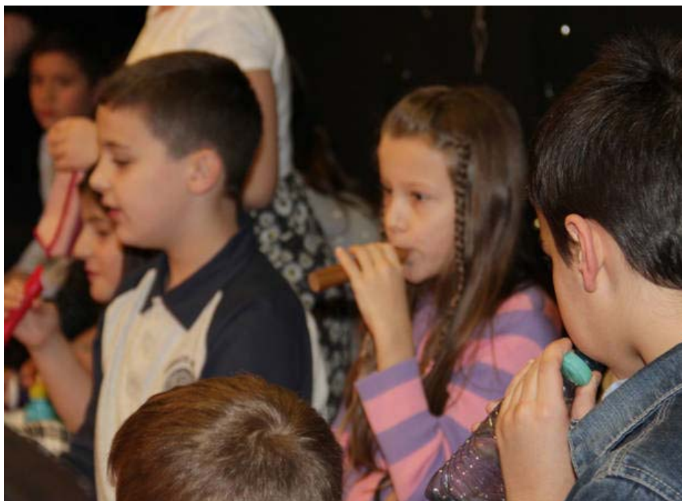
Kompisation der 4B derVS Neustiftgasse