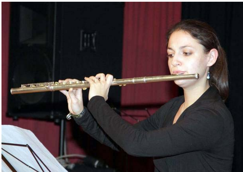
Studierende der Musikuni mit: "Image" für Flöte solo von Eugène Bozza