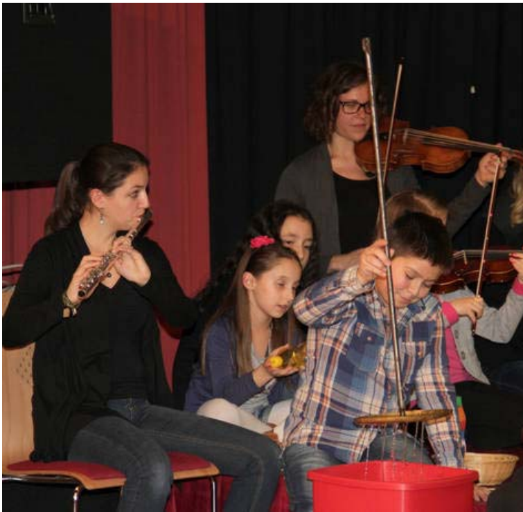
Kompisation der 4B derVS Neustiftgasse