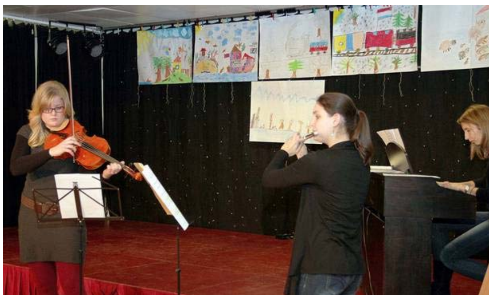
Studierende der Musikuni mit: "Tico Tico" von Zequinha Abreu für Flöte, Viola und Klavier