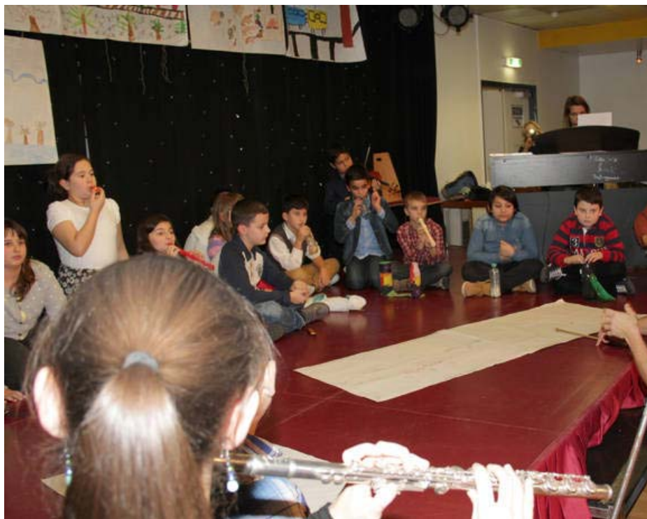
Kompisation der 4B derVS Neustiftgasse