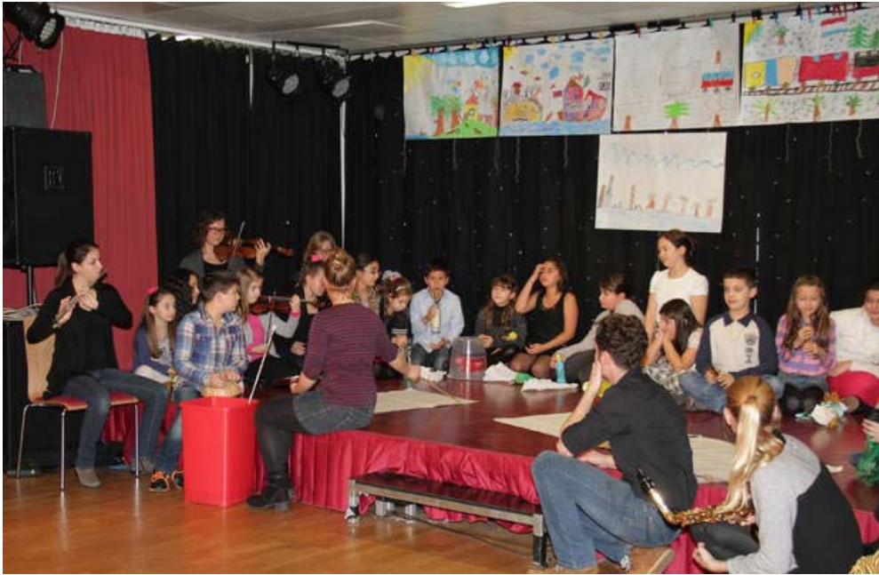
Kompisation der 4B derVS Neustiftgasse