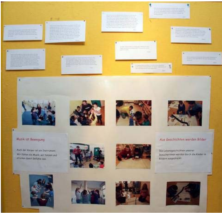
Ausstellungstafeln mit Erfahrungsberichten der Schüler_innen