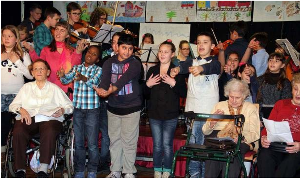
Ein neu getexteter "Neubau"-Walzer