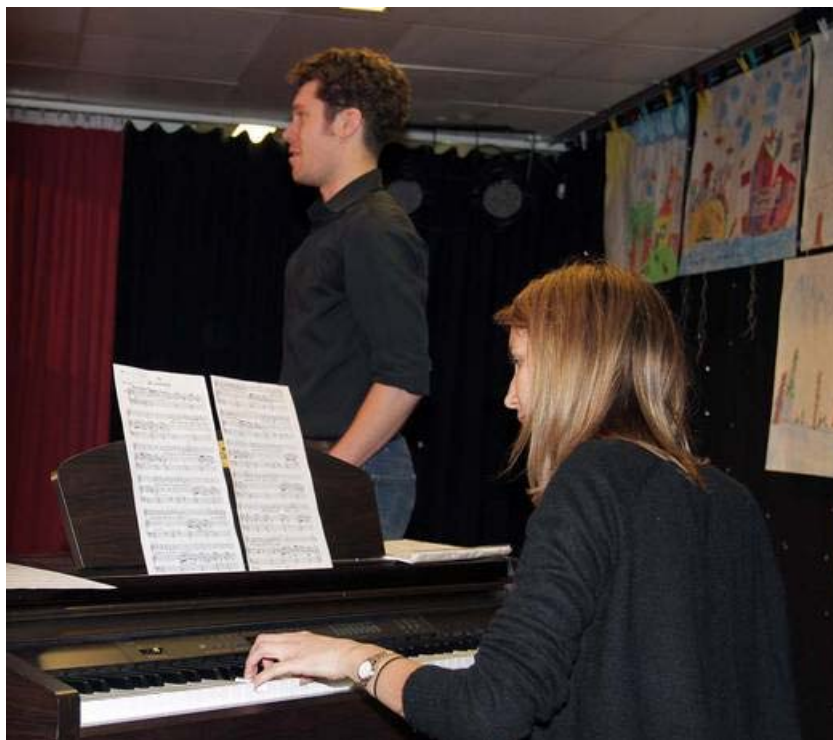
Studierende der Musikuni mit: "Der Leiermann" (aus der "Winterreise" von Franz Schubert