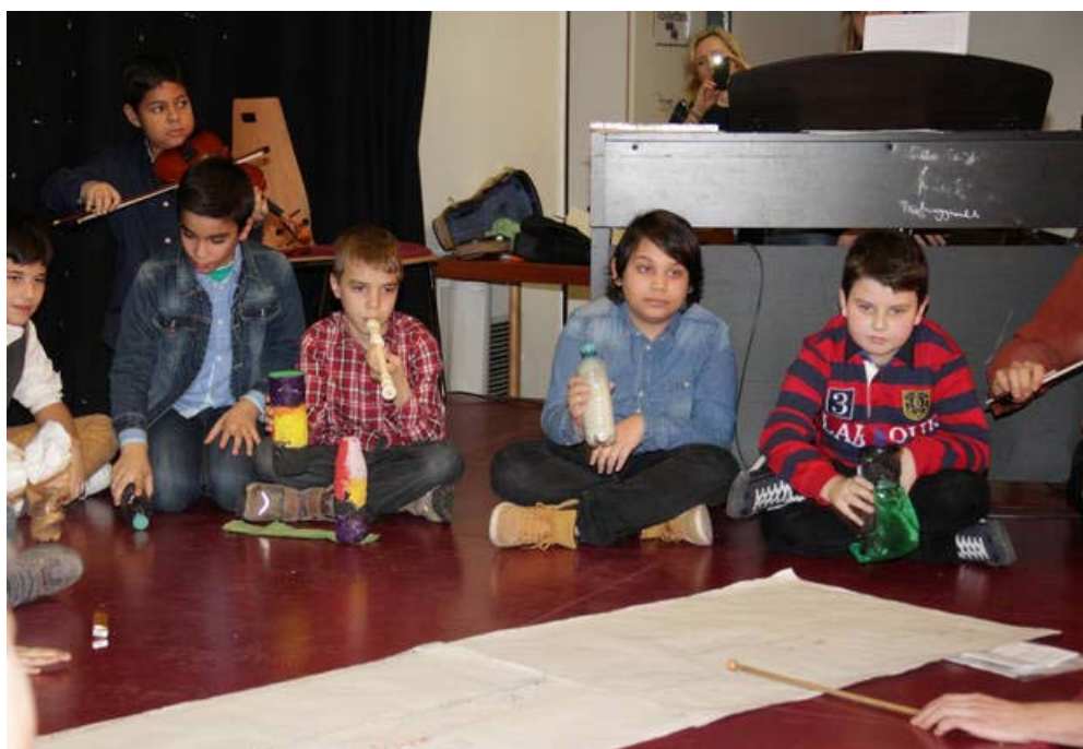
Kompisation der 4B derVS Neustiftgasse