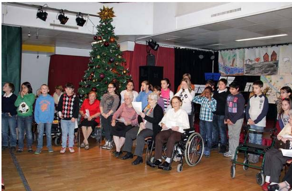
Gemeinsames Singen, unter anderem von "immer wieder kommt ein neuer Frühling" von Rolf Zuckowski