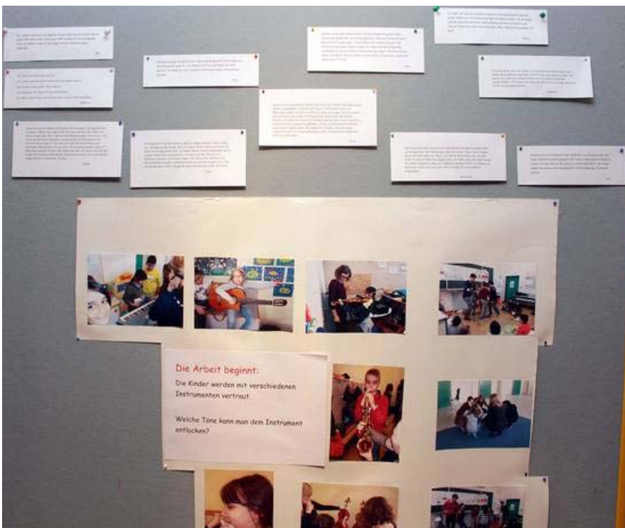
Ausstellungstafeln mit Erfahrungsberichten der Schüler_innen