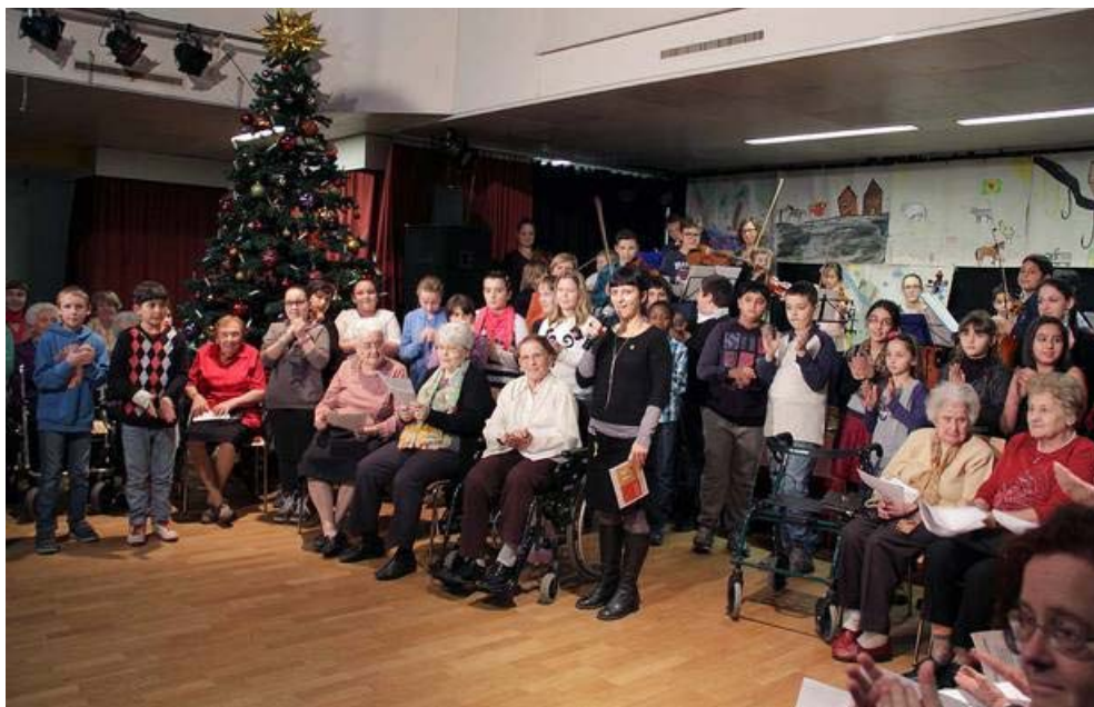
Gemeinsames Singen, unter anderem von "immer wieder kommt ein neuer Frühling" von Rolf Zuckowski