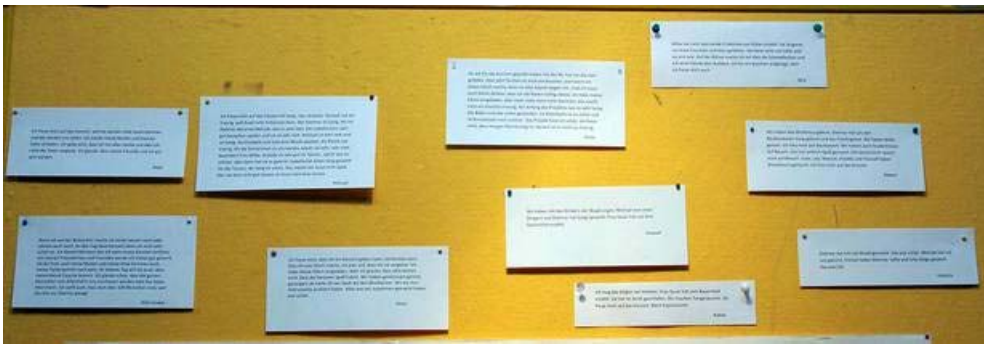
Ausstellungstafeln mit Erfahrungsberichten der Schüler_innen