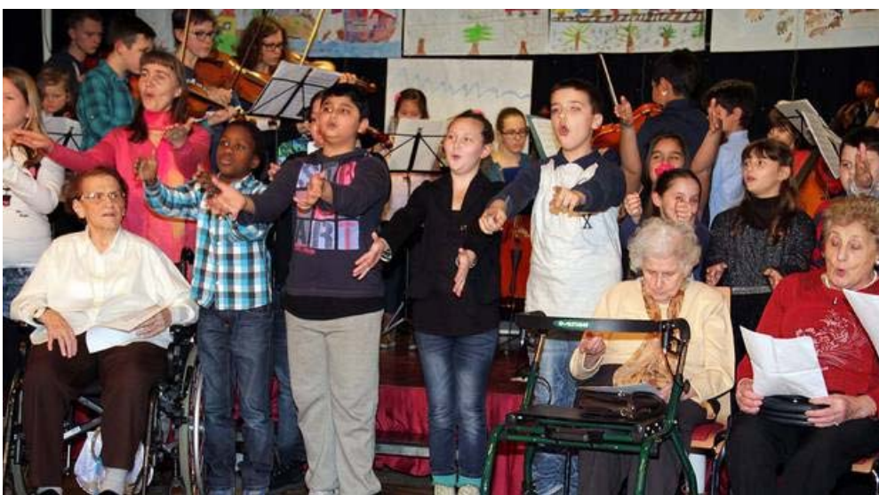
Ein neu getexteter "Neubau"-Walzer