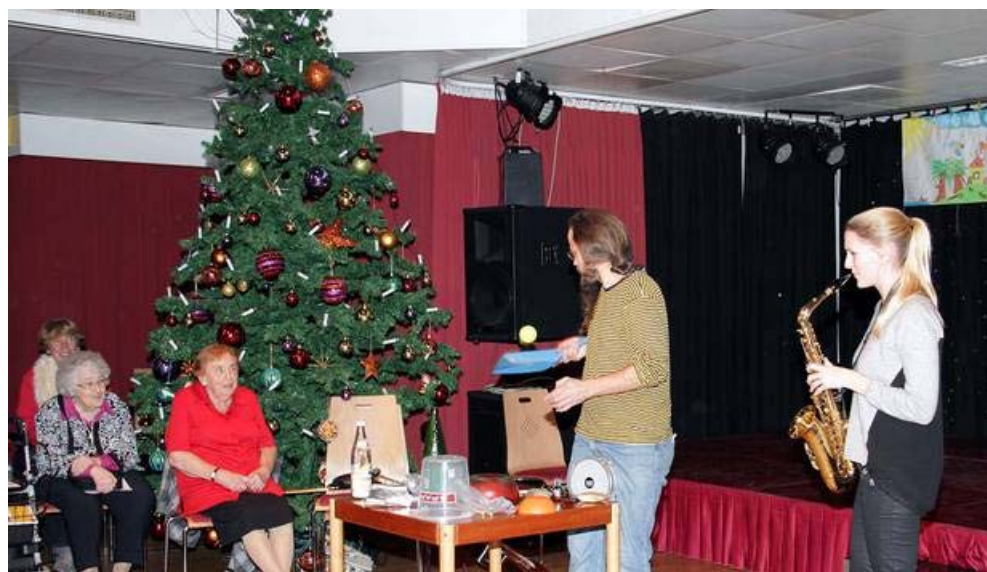
Studierende der Musikuni mit: Espresso Groove für Saxophon, Gitarre und Allerlei