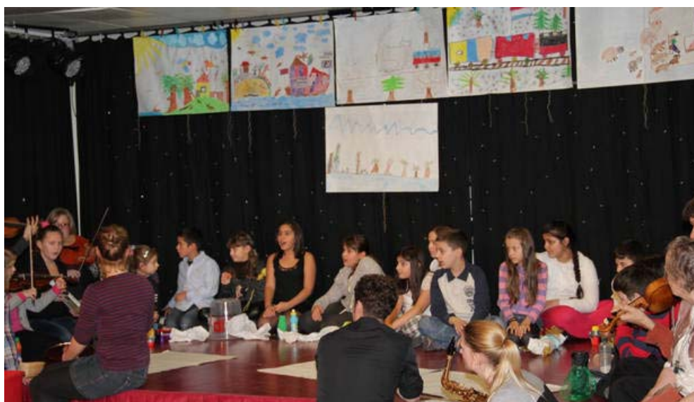
Kompisation der 4B derVS Neustiftgasse