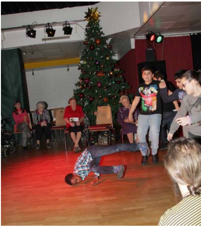
Komposition der 4A der VS Neustiftgasse