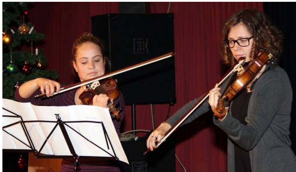
Studierende der Musikuni mit: Duos für zwei Violinen von Béla Bartók