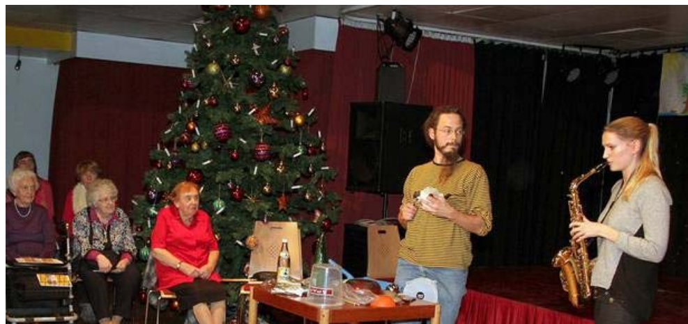
Studierende der Musikuni mit: Espresso Groove für Saxophon, Gitarre und Allerlei