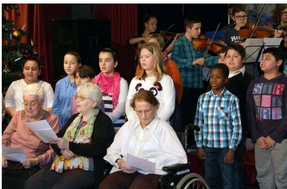
Gemeinsames Singen, unter anderem von "immer wieder kommt ein neuer Frühling" von Rolf Zuckowski